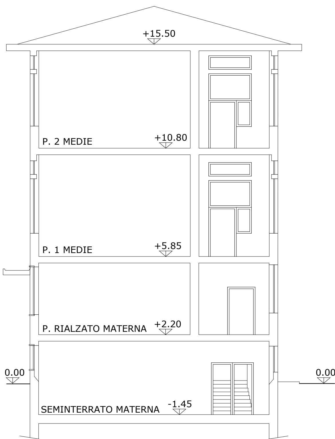
SEZIONE B - B